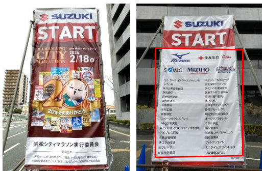
ハーフスタートタワー